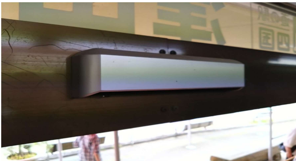
<補助光線センサ>対向1光線（プレート付き）