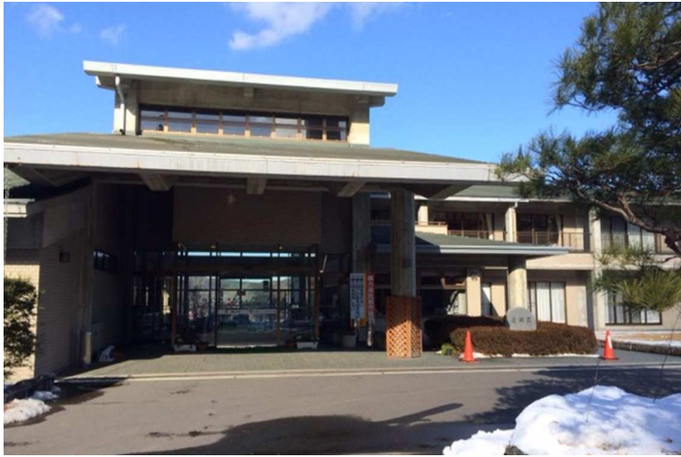
福島県郡山市逢瀬町河内字西午房沢11-2 郡山市高齢者文化休養センター逢瀬荘 様

昭和63年に設置された当該施設は、高齢者の文化の向上及び福祉の増進を図ることを目的とし、高齢者を中心に様々な方に利用されています。 自動ドア装置も20年経過しており、保守業者からは異音が発生しているという指摘を受けていました。 振興会は、通行者の安全と安心のために、自動ドア装置一式を寄付して、不安を解消しました。