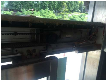
③ 老朽化自動ドア装置