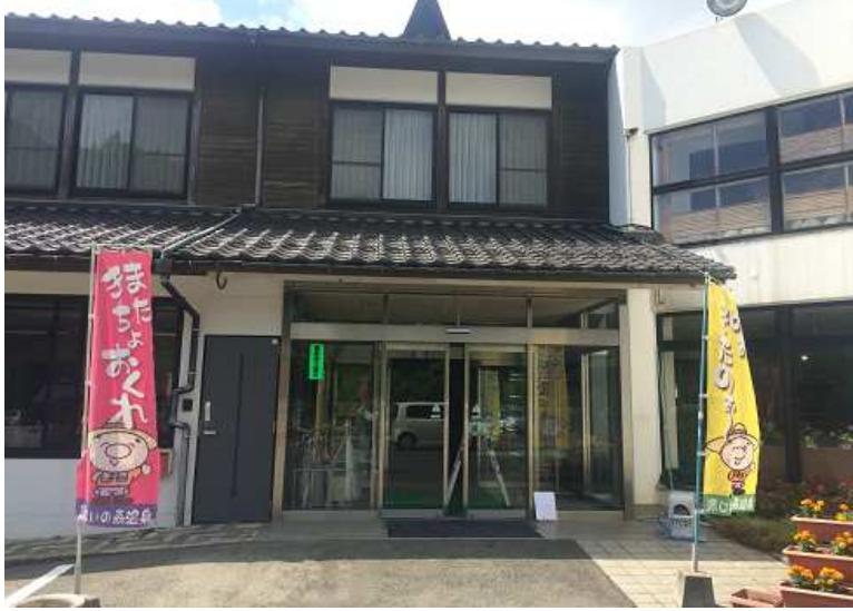
福岡県田川郡赤村大字6933番地1 源じいの森ほたる館 様

平成4年に地域の観光拠点として開業し、年間を通じて多くの宿泊者が来館する複合施設で、災害時には避難所としての一面も備えており、地域にとってなくてはならない施設です。