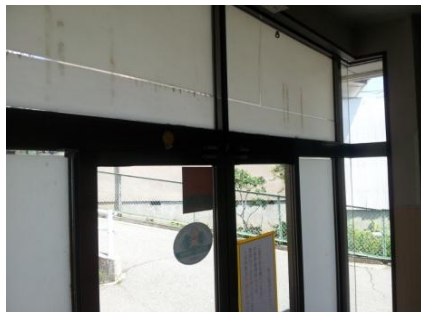
② 両袖隙間塞ぎ部材取付