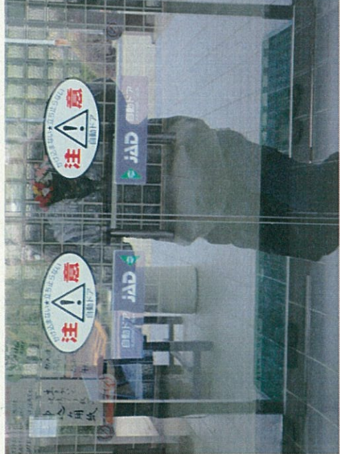
内側自動ドアー(室内より)