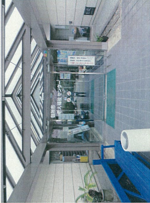
玄関ドアー(H26年外側交換)