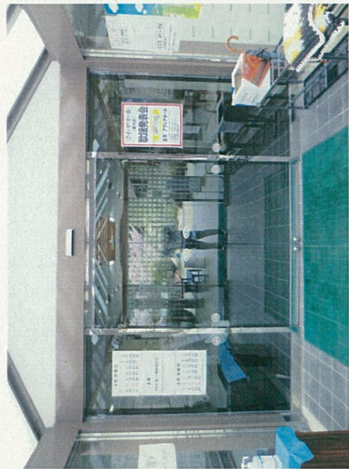
内側自動ドアー(H28年交換)