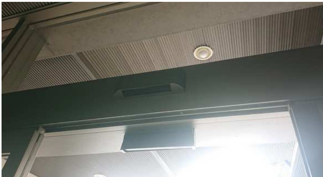
補助光線センサ (対向1光線)