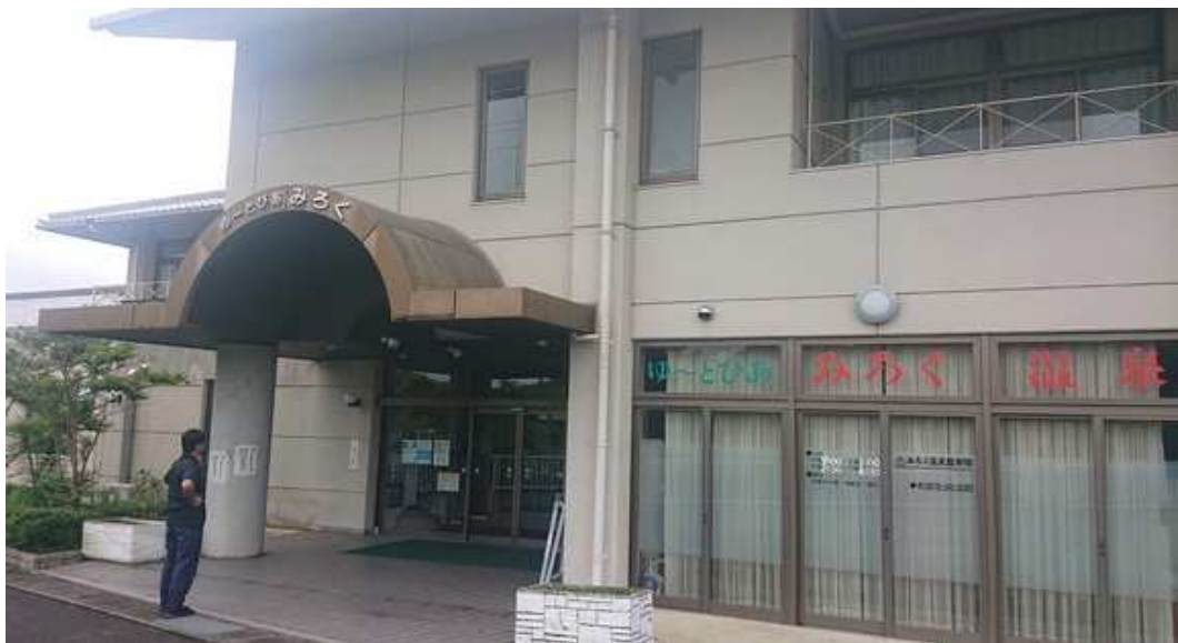
自動ドアフロント外観