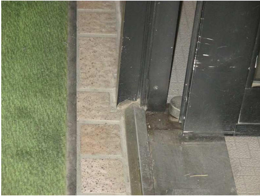
持出吊フロアヒンジ